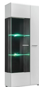
SOLIDO TWIN SYSTEM witrażna lewa / showcase left →80cm ↑190cm ↗35cm

📦1/2 →200cm ↑10cm ↗41cm 📦2/2 →200cm ↑6cm ↗52cm 📦+📦=60kg